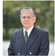
学 長 富 永 嘉 男

最近の図書館の蔵書数は何級数的な速度で増加しており、それらを収納するためには、新たなスペースを確保するか、あるいは限られたスペースの中でそれらを収納するために、高さ方向に積み上げ立体的に収蔵する集密書架が考案され、多くの図書館ではこの方式が採用されていると聞く。しかし限られた場所に重さが集中するため、単位面積当たりの重量が増加し耐床荷重やそれに伴う建築費などの増加を勘案すると集密書架による方法にも限界があるように思う。これを克服する方法の一つとして近年、発展著しい電子技術の情報分野への利用がある。多くの図書館では、文化遺産である貴重な書籍や、膨大な記録や資料をCD/DVD-ROMやデータベースなどとして電子化することが急速に進められている。これは単に保管スペースの確保だけでなく、収蔵図書 of 長期保存と保管の安全性の確保や検索の容易性など図書資料の利用面における利便性の面でも、大きな恩恵をもたらしていることは素晴らしいと思う。さらに学会誌を始め速報性が重んじられる定期刊行の専門誌