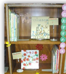
ミニ展示 「春のおすすめ絵本」(2016.3)