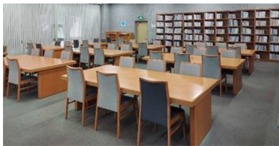
3階絵本コーナー付近（絵本書架）