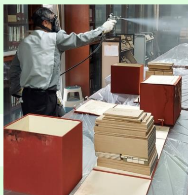
②ガスを使った消毒の様子