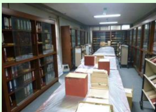
①展示ケース養生の様子

貴重な近松文庫や吉永文庫、軸巻物等の保管を行っている部屋です。図書館ができてから長い 年月が経っており、害虫被害から本学の貴重な財産を守るため、この夏休み中に実施しました。 燻蒸日当日、ガスマスクを装着された業者の担当者の方が貴重書庫内に入り、念入りに作業を 行っていただきました。その後、室内を数時間完全に密室状態にして作業は完了しました。 これからも図書館は、本学が大切に保存してきた資料管理に引き続き努めていきます。