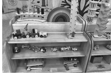
図2 おもちゃの一部